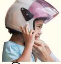
सुरक्षित बाल प्रवासी

वाहतूक पोलिस आणि शैक्षणिक संस्थांद्वारे नियमांची अंमलबजावणी